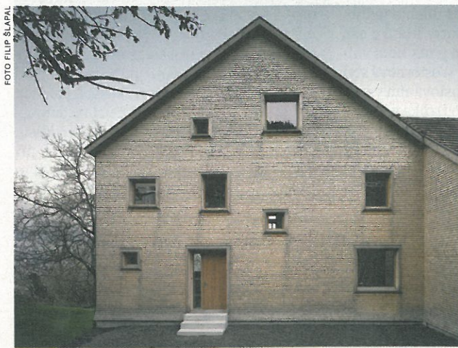
Severní fasáda s hlavním vstupem je značně kompaktní, jsou v ní umístěny pouze menší okenní otvory.

Jedním z neduhů současné české architektury je její relativně malá možnost přímo se konfrontovat se zahraničím. Jen málo českých architektů se účastní mezinárodních soutěží a jen málo z nich realizuje stavby mimo svou zemi. Z tohoto hlediska je nedávné dokončení rodinného domu ve Švýcarsku, tedy v zemi s jednou z nejvyšších stavebních kultur na světě, událostí.