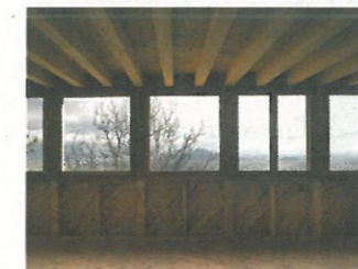
Výhled z typického patra a nosná trémová stropní konstrukce, která v budoucnu umožní libovolné vnitřní členění.

povolení musela být mnohem méně podrobná, než je tomu v Česku, a jejich řešení se na místním úřadě setkalo s mimořádnou vstřícností. Naopak pro souhlas sousedů je ve Švýcarsku nutné zrealizovat z obvodových latí kostru domu ve skutečné velikosti. Je to náročné, ale efekt za to stojí: model pomůže všem v okolí, ale nezřídka také objednavatelům i autorům, uvědomit si skutečný rozsah připravované novostavby. ■