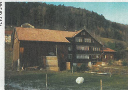
Původní stav před vyhořením ukazuje harmonický vztah stodoly a rodinného domu.

povolení musela být mnohem méně podrobná, než je tomu v Česku, a jejich řešení se na místním úřadě setkalo s mimořádnou vstřícností. Naopak pro souhlas sousedů je ve Švýcarsku nutné zrealizovat z obvodových latí kostru domu ve skutečné velikosti. Je to náročné, ale efekt za to stojí: model pomůže všem v okolí, ale nezřídka také objednavatelům i autorům, uvědomit si skutečný rozsah připravované novostavby. ■