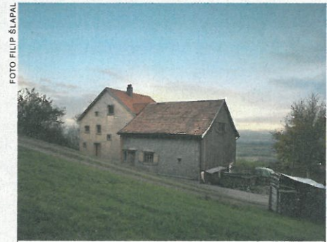
Náhrada je posunuta o kousek dolů po svahu, jinak zůstal proporční vztah zachován.

ADRESA: MOHREN, REUTE (AR), ŠVÝCARSKO AUTOŘI: MARCELA STEINBACHOVÁ, MARTIN RUSINA / SKUPINA (PRAHA) SPOLUPRÁCE: LINDA KOLOMAZNIKOVÁ, AED PROJECT, ROBERT MARTE (MARTE ARCHITEKTUR – SUSTAINABLE DESIGN, ŠVÝCARSKO) ZASTAVĚNÁ PLOCHA: 111 M 2 OBESTAVĚNÝ PROSTOR: 1300 M 2 Hlavní dodavatelé: GRAF BAU – REHETOBEL, STURZENEGGER HOLZBAU, HUBER FENSTER – HERISAU, SVĚPOMOC PROJEKT: 2008–2012 REALIZACE: 2013–2014 HTTP://WWW.SKUPINA.ORG/