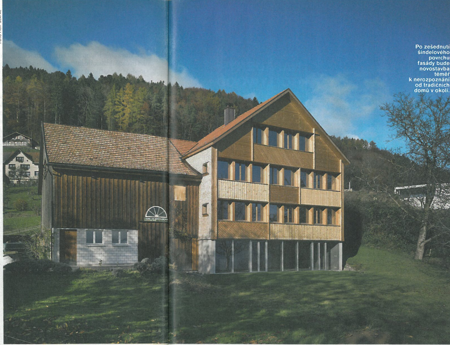
Po zešednutí šindelového povrchu fasády bude novostavba téměř k nerozpoznání od tradičních domů v okolí.