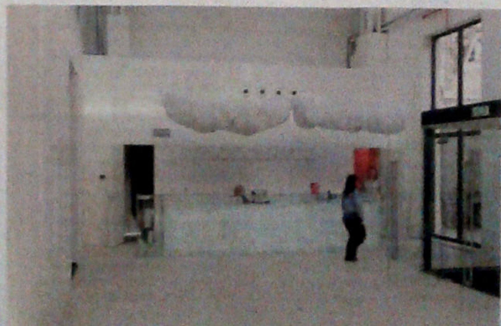
Původní konstrukce zůstala zachována a je doplněna nezakrytými technickými instalacemi. Za vstupní halou následuje chodba mezi prosklenými jednácními místnostmi, už vstupní prostory naznačují velkorysost, která následuje