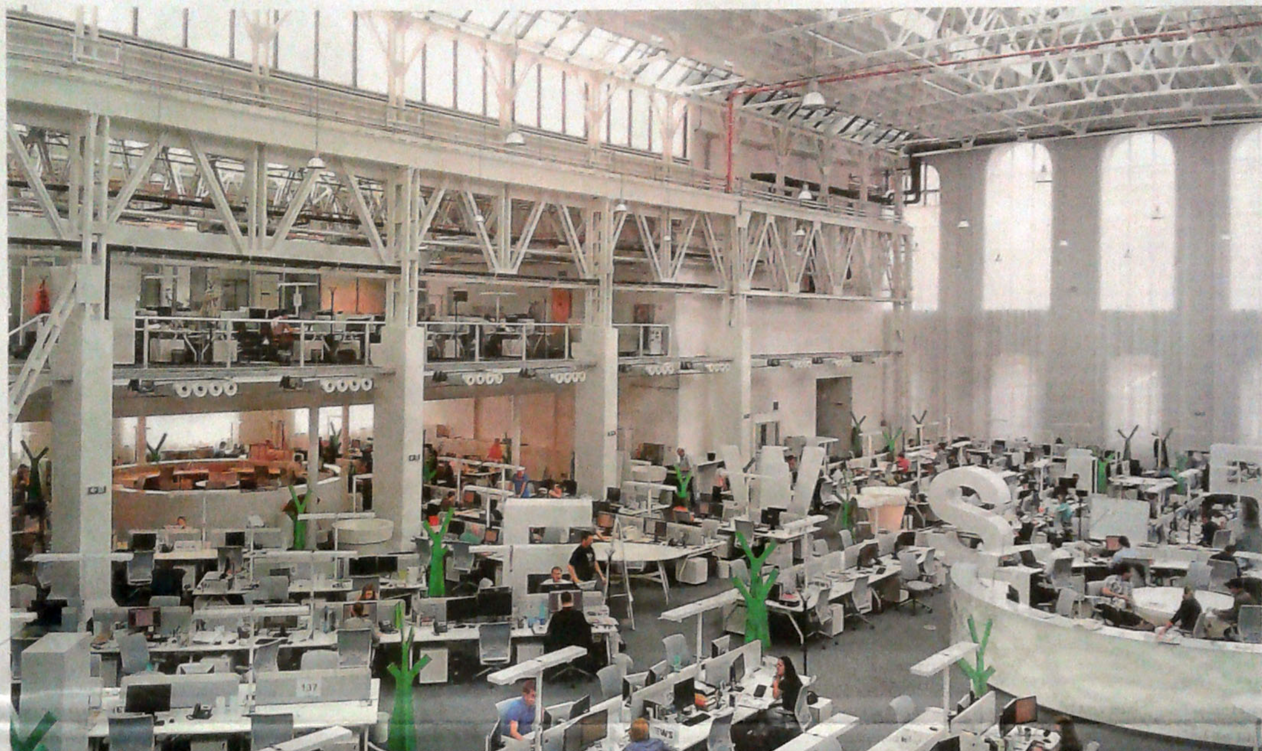
Velkorysá, nabílo nabarvená hala působí až chrámovým dojmem

Nová superredakce tiskovin vydávaných vydavatelstvím Economia schytila kritiku ze všech stran. Zbytečně